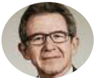
John Browne 前BP CEO